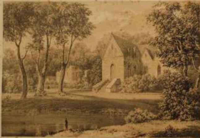
KLARYSKA — Północny widok — Wschodnia część miasta

Widok z południowo-wschodniej strony zamek Kazimierz, wzniesiony w 1370 roku przez króla Kazimierza Wielkiego. W 1596 roku zamek został spalony przez Szwedów. W 1831 roku zamek został odbudowany przez króla Michała Augustego. W 1915 roku zamek został zniszczony przez Niemców. W 1945 roku zamek został odbudowany przez Polaków. W 1950 roku zamek został wpisany na listę zabytków UNESCO.