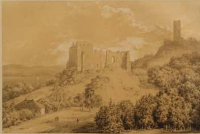
KAZIMIERZ NA WISŁE — Północny widok — Wschodnia część miasta

Widok z południowo-wschodniej strony zamek Kazimierz, wzniesiony w 1370 roku przez króla Kazimierza Wielkiego. W 1596 roku zamek został spalony przez Szwedów. W 1831 roku zamek został odbudowany przez króla Michała Augustego. W 1915 roku zamek został zniszczony przez Niemców. W 1945 roku zamek został odbudowany przez Polaków. W 1950 roku zamek został wpisany na listę zabytków UNESCO.