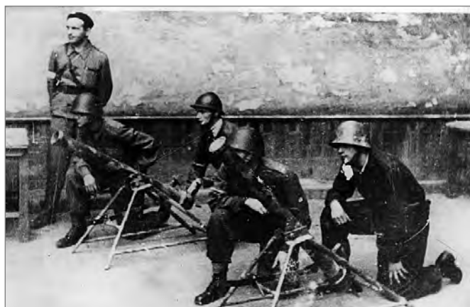
Grupa powstańców obsługujących granatniki projektu Mieczysława Łopuskiego ps. Konstruktor na stanowiskach