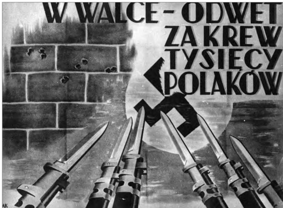
Plakat z czasów powstania warszawskiego