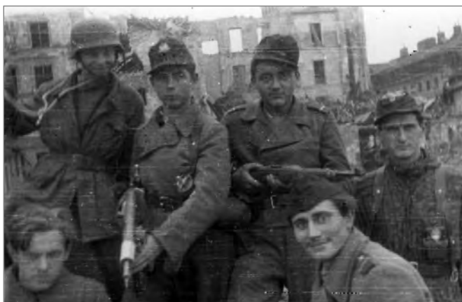
Żołnierze batalionu Miotła na terenie Starego Miasta, II poł. sierpnia 1944 r.