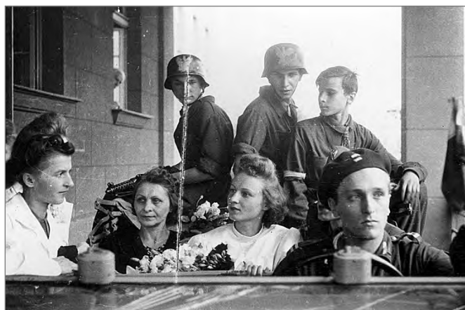
Para młoda i grupa powstańców w zdobyczym niemieckim samochodzie Kübelwagen (typ 82) na podjeździe przed Szpitalem Sióstr Elżbietanek przy ulicy Goszczyńskiego 1