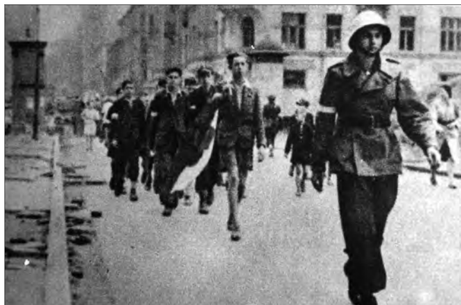
Grupka nastolatków w biało-czerwonych opaskach maszerująca środkiem ulicy. Idący jako drugi niesie polską flagę