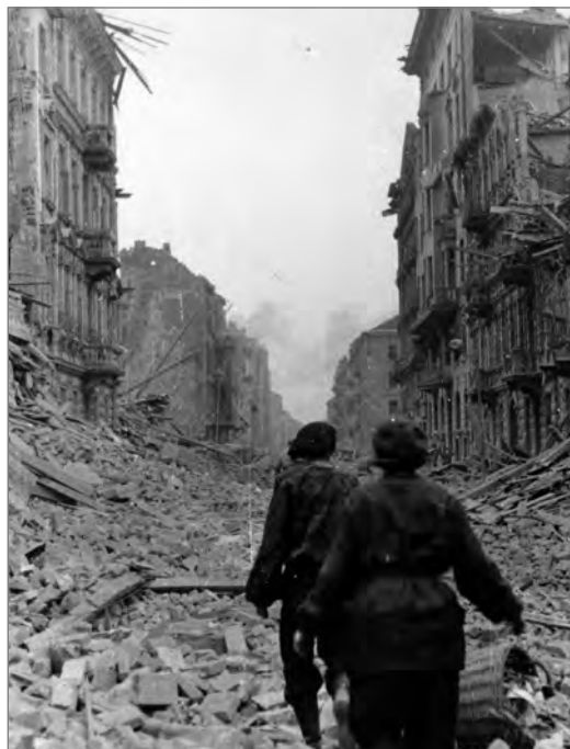
Zniszczenia zabudowy w czasie Powstania Warszawskiego