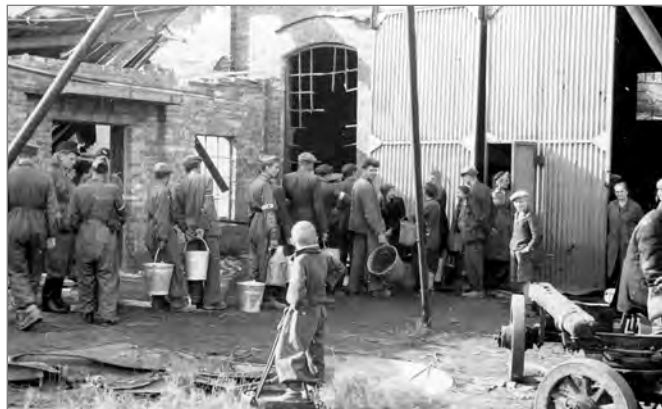
Kolejka po wodę na terenie Fabryki Kotłów Parowych i Konstrukcji Żelaznych J. Markiewicz i Synowie (zał. 1905) przy ul. Raclawickiej 10