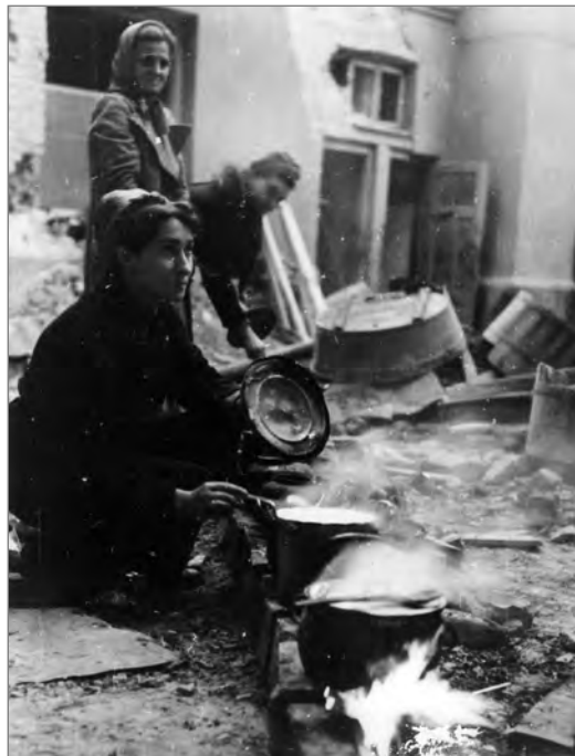
Kobiety przygotowują posiłek w czasie Powstania Warszawskiego