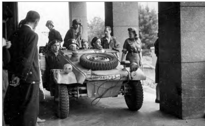
Grupa powstańców w zdobyczym niemieckim samochodzie VW Kübelwagen (typ 82) na podjeździe przed Szpitalem Sióstr Elżbietanek przy ulicy Goszczyńskiego 1