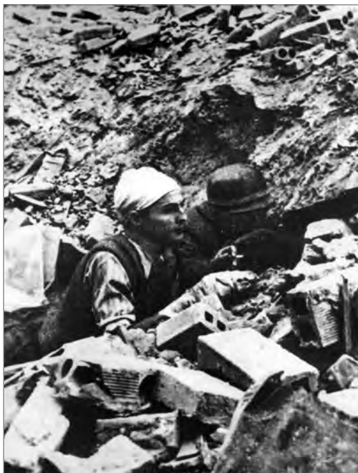
Dwóch bojowników na stanowisku ogniowym w gruzach