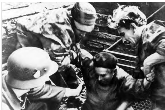
Powstaniec ze Starówki wychodzzący z kanału na ul. Nowy Świat, róg ul. Wareckiej