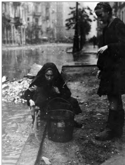
Kobiety nabierające wodę na jednej z ulic w czasie Powstania Warszawskiego (AIPN)