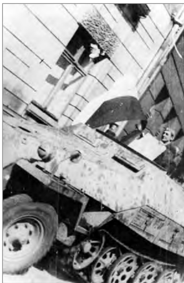
Niemiecki transporter opancerzony Sd.kfz. 251/3 z 5. pancernego batalionu łączności SS 5. Dywizji Pancerniej SS „Wiking” (niem. SS-Panzer-Nachrichtenabteilung 5, 5. SS-Panzer-Division „Wiking”) zdobyty na ul. Bartoszewicza przez żołnierzy 107. plutonu 2. kompanii (d-ca por. Jan Jasiński ps. Jaś) VIII Zgrupowania AK „Krybar” podczas przejazdu ulicami Powiśla. Za tarczą osłony karabinu maszynowego późniejszy dowódca transportera plut. pchor. Andrzej Dęwicza ps. Szary Wilk