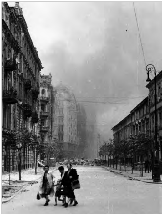
Barykada oddzielająca plac Napoleona od ul Szpitalnej w czasie Powstania Warszawskiego