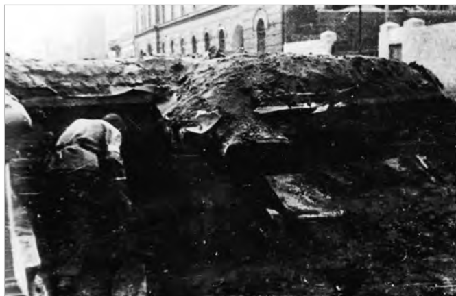
Wysoka barykada powstańcza na ul. Chmielnej. Po lewej powstaniec przy wejściu do schronu-ziemianki wbudowanego w barykadę