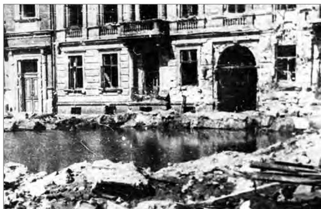
Wypełniony wodą krater po wybuchu pocisku niemieckiej ciężkiej artylerii na podwórzku kamienicy w czasie powstania warszawskiego