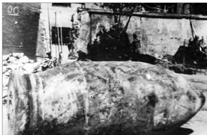
Niewybuch pocisku kal. 600 mm z niemieckiego najcięższego moździerza samobieżnego (60 cm Mörser „Karl” Gerät 040, najprawdopodobniej pojazd nr VI [Gerät VI] „Ziu” z 638. baterii artylerii najcięższej) zabezpieczony przez powstańców prawdopodobnie na terenie Śródmieścia w II połowie sierpnia 1944 r. - zbliżenie na ulicy na tle muru z wyrwą