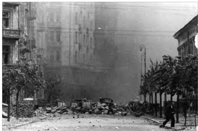
Barykada oddzielająca plac Napoleona od ul Szpitalnej w czasie Powstania Warszawskiego