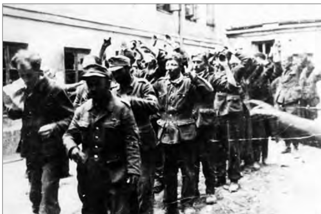
Grupa jeńców niemieckich wziętych do niewoli powstańczej po zdobyciu budynku PAST (ul. Zielna 39) na podwórzu kamienicy przy ul. Zielnej 34 przed odprowadzeniem - zbliżenie od przodu