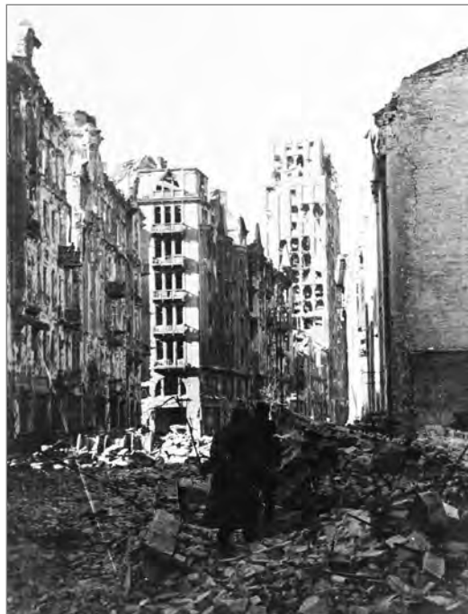
Zniszczone budynki przy Placu Napoleona