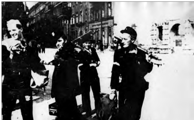
Grupa czterech uzbrojonych powstańców z białoczerwonymi opaskami na dłoni