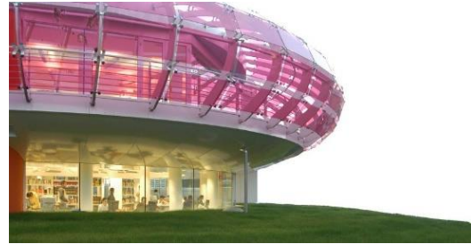
Biblioteka im. Sandro Penna w Perugii.

szklanego dysku, rozświetlonego nocą. Znakiem rozpoznawczym budynku są też otwarte przestrzenie, naturalne światło i kolorowe meble. Wiele osób zachwyca się wyglądem biblioteki w Perugii, choć złośliwi nazywają ją różowym UFO.