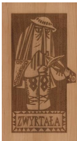
Wizerunek Zwyrtały na pamiątkowej plakietce

12 lipca 2019 r. w kinie „Śnieżka” w Rabce-Zdroju odbył się finał pierwszej edycji ogólnopolskiego Konkursu na najlepszy pomysł promujący czytelnictwo – „Zwyrtała 2019”, organizowanego w ramach Międzynarodowego Festiwalu Literatury Dziecięcej Rabka Festival 2019.