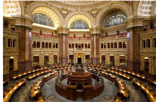
Czytelnia Biblioteki Kongresu, fot. Carol M. Highsmith. Źródło: Wikipedia

Mówiąc o obiektach uznanych za rekordowe, nie można pominąć największej na świecie Biblioteki Kongresu w Waszyngtonie. Jej zbiory liczą ponad 160 mln egzemplarzy. Rocznie to miejsce odwiedza blisko 1,75 mln ludzi, a zatrudnionych jest przeszło 3,5 tys. osób. Można tu znaleźć między innymi: Biblię Gutenberga, najmniejszą książkę świata – Old King Cole czy kolekcję kieszonkowych globusów.