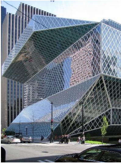
Seattle Central Library, której projektantem jest architekt Rem Koolhaas.

jedenastopiętrowy budynek charakteryzuje się niezwykłą bryłą i śmiałymi elementami wystroju wnętrza.