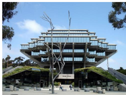
Geisel Library – główna biblioteka uniwersytetu w San Diego, ufundowana przez Theodora Geisela.

Jednym z takich nietypowych budynków jest Biblioteka Uniwersytetu Kalifornijskiego w San Diego. Zaprojektował go William Pereira w latach sześćdziesiątych XX wieku. Każdy kto patrzy na tę bibliotekę ma inne skojarzenia. Jedni porównują ją do baobabu, inni do budynków z kreskówki o rodzinie Jetsonów. Mimo że Biblioteka Uniwersytetu Kalifornijskiego w San Diego ma już 50 lat, nadal zadziwia swoją futurystyczną formą. Zdają sobie z tego sprawę filmowcy i chętnie wykorzystują budynek w produkcjach science fiction.