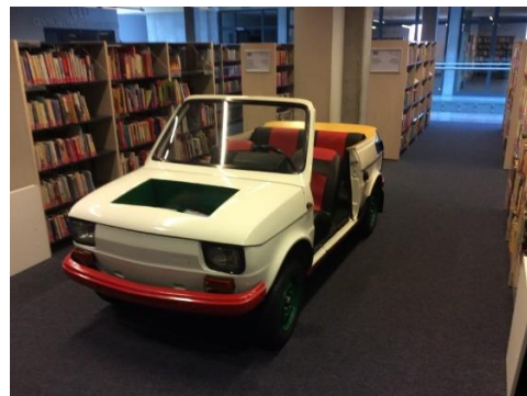
MBP w Oświęcimiu

W Miejskiej Bibliotece Publicznej im. Łukasza Górnickiego w Oświęcimiu uczestnicy wyjazdu poznali strukturę organizacyjną, nowoczesny sprzęt wykorzystywany w bibliotece oraz szczegóły organizacji oryginalnych przedsięwzięć, m.in.: „Mikroświat zabawy”, „Uniwersytet Bibliotecznych Żaków”, „Biblioteka Młodych”, „Akademia Rodzica”, „Edukacja przez całe życie”, „Perspektywa dla Ambitnych!”, „Nocny Maraton Wiedzy”, „Noc Maturzystów”, „Aleja Pisarzy”.