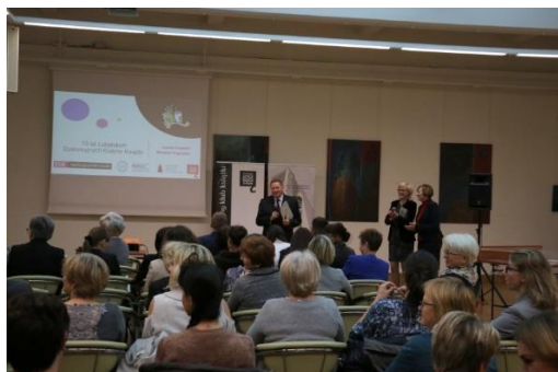
Uroczyste rozpoczęcie imprezy jubileuszowej

DKK to adaptacja brytyjskiej idei reading clubs – wspólnego czytania i rozmowy o książkach. Kluby istnieją tam od 1926 r. i są niezwykle istotnym elementem życia literackiego, mają wpływ na rynek książki, w tym na najważniejsze nagrody literackie, a nawet na nakłady książek.