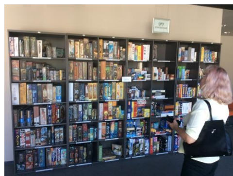
Arteteka – WBP w Krakowie

Kolejną placówką, którą odwiedzili uczestnicy wyjazdu była krakowska Arteteka – nowoczesne miejsce znajdujące się w strukturach WBP. Bibliotekarze poznali nowoczesne wyposażenie placówki oraz sposoby jego wykorzystania. Zapoznali się z oryginalnymi działaniami podejmowanymi w Artetece: „DIY Działaj!”, „Muzyka niejedno ma imię”, „Jak wejść do aparatu?”, „Poznaj świat animacji”, „Od papieru do ekranu”, „Czym jest literatura?”, „Konwersacje językowe”. Zaprezentowano także możliwości wykorzystania wydruku przestrzennego 3D w pracy biblioteki.