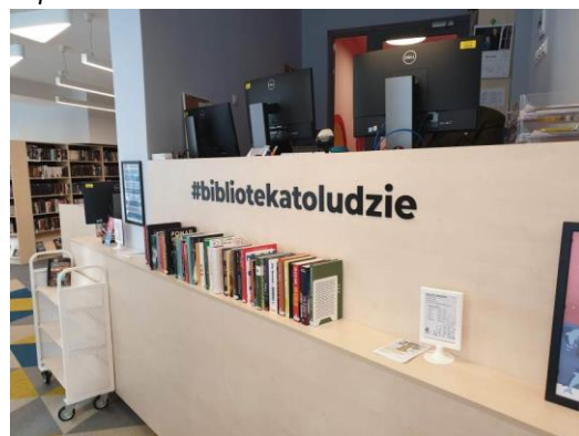
Filia MBP w Gdyni