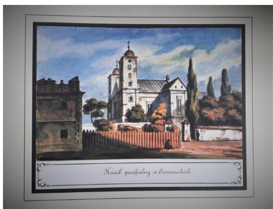
Kościół parafialny w Czemiernikach, akwarela