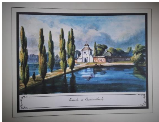
Zamek w Czemiernikach, akwarela