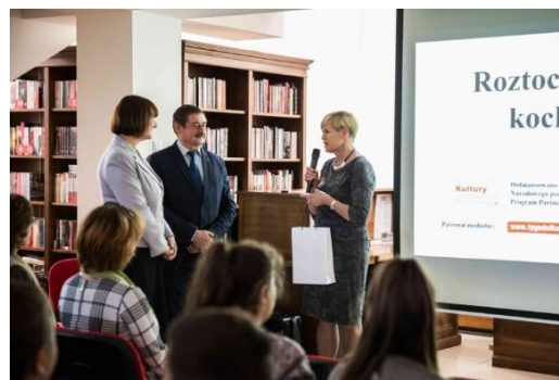
Gratulacje i słowa uznania dla realizatorów projektu „Roztoczańskie anioły kochają książki”