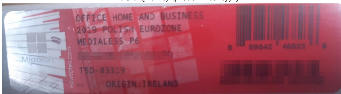
Rys. 2 przykładowy kod zabezpieczony przez producenta systemu Microsoft Windows Office Home&Business z wymazanym, znajdującym się w prawym dolnym rogu numerem seryjnym produktu. Kod licencyjny znajduje się w środku szczelnie zapakowanego i zafoliowanego pudełka (Rys. 3).