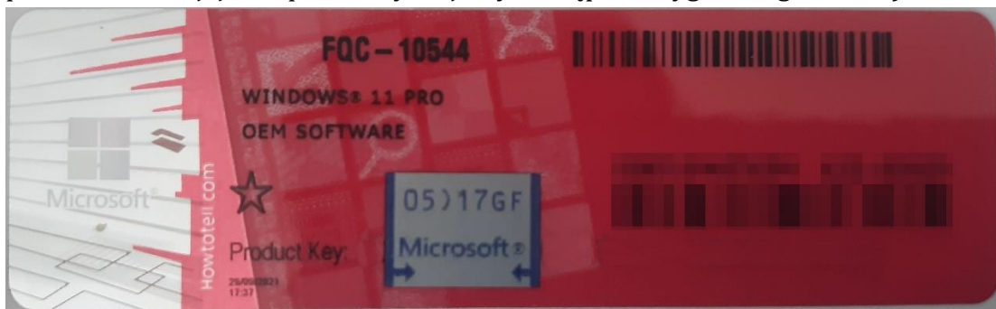
Rys. 1 przykładowy kod zabezpieczony przez producenta systemu Microsoft Windows 11 (takie same naklejki mają Windows 10) z wymazanym, znajdującym się przed i za szarą naklejką kodem licencyjnym.

Poniższe zdjęcie obrazuje obecnie stosowane zabezpieczenia producenta firmy Microsoft (klucz systemu jest zabezpieczony naklejką hologramową przez producenta. Po jej zdrapaniu uzyskujemy dostęp do oryginalnego klucza):