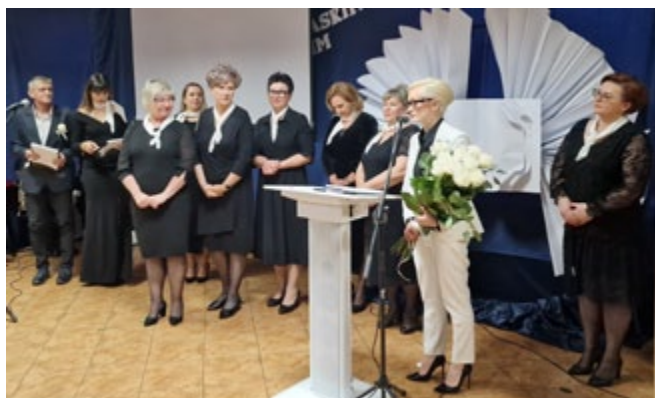
Dyrektor GBP z Zespołem

W piątek, 7 lutego Gminna Biblioteka Publiczna w Międzyrzecu Podlaskim z siedzibą w Wysokim, świętowała swój jubileusz 40-lecia. Było to wyjątkowe popołudnie, które na długo pozostanie w pamięci i sercach wielu ludzi. Szczególnie ciepło wspominać je będzie zespół Biblioteki, gdyż bardzo wielu gości zaszczyliło tę uroczystość swoją obecnością.