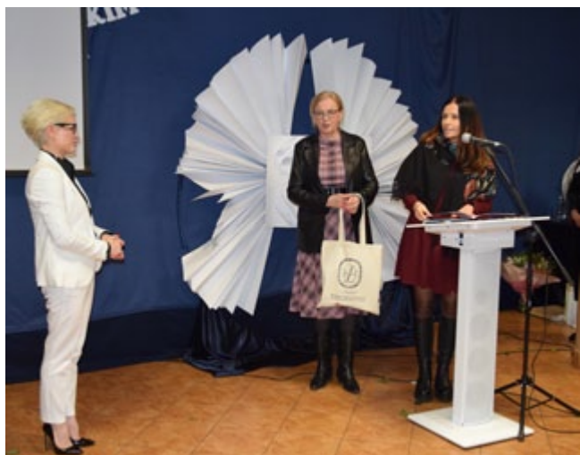
Życzenia – przedstawiciele Wojewódzkiej Biblioteki Publicznej

niami z etapów budowania zespołu, ale także podkreślili, że wydarzenie jest też jubileuszem 10-lecia Jej pracy jako dyrektora placówki.