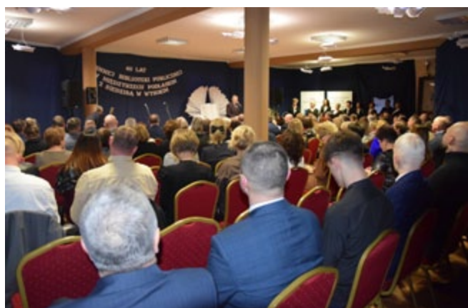
Uczestnicy Jubileuszu GBP

W piątek, 7 lutego Gminna Biblioteka Publiczna w Międzyrzecu Podlaskim z siedzibą w Wysokim, świętowała swój jubileusz 40-lecia. Było to wyjątkowe popołudnie, które na długo pozostanie w pamięci i sercach wielu ludzi. Szczególnie ciepło wspominać je będzie zespół Biblioteki, gdyż bardzo wielu gości zaszczyliło tę uroczystość swoją obecnością.