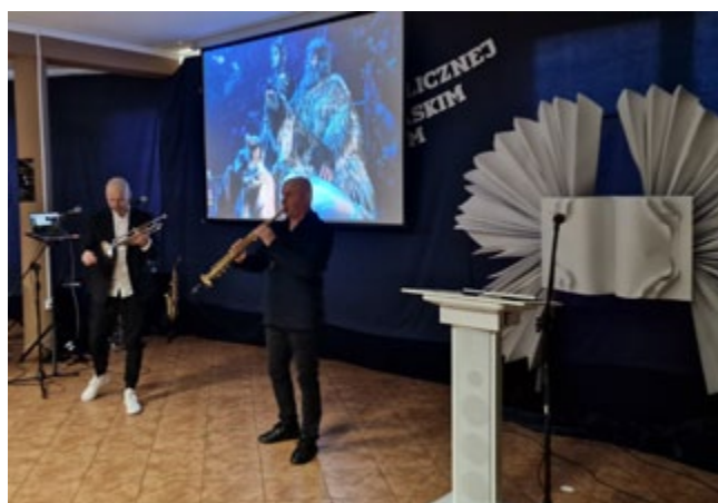
Koncert zespołu Live Duet

„W naszym funkcjonowaniu bardzo często pojawia się motyw skrzydeł, mówimy o tym, że je mamy, że ciągle rosną i że ciągle pojawiają się w nich nowe pióra. Dzisiaj również, a może nawet przede wszystkim dzisiaj, te skrzydła są pięknie rozpostarte. (...) Gminna Biblioteka Publiczna w Międzyrzecu Podlaskim z siedzibą w Wysokim, to anioł z ogromnymi skrzydłami – jedno skrzydło tworzy nasz zespół, drugie wszyscy ci, z którymi współpracujemy, którzy nas wspierają i są nam życzliwi. Wy, drodzy Państwo, jesteście naszym drugim skrzydłem. (...) Dzisiejszy jubileusz nie jest po to, by prezentować Państwu naszą działalność, ale po to, byście cieszyli się razem z nami i świętowali miejsce, w jakim jest Biblioteka, bo na to, w jakim jest miejscu, każdy z Państwa tu dzisiaj obecny miał lub ma wpływ” – tymi słowami dyrektor M. Chodzińska przekazała gościom zamysł i ideę uroczystości, a także podziękowała ludziom i środowiskom, z którymi biblioteka współpracuje, które ją wspierają i współtworzą.